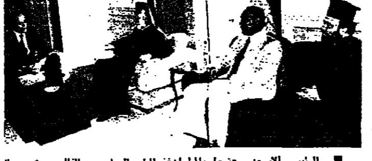
الرئيس الاسعد مجتمعا بالمران نغرايل الصليبي والقابن ميشال سلقين